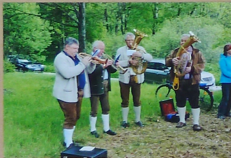
Vier Weisenbläser von Ulrichsberg umrahmten die stimmungsvolle Feier

Čtyři hudebníci z obce Ulrichsberg hrající na dechové nástroje doprovodili dojemnou slavnost