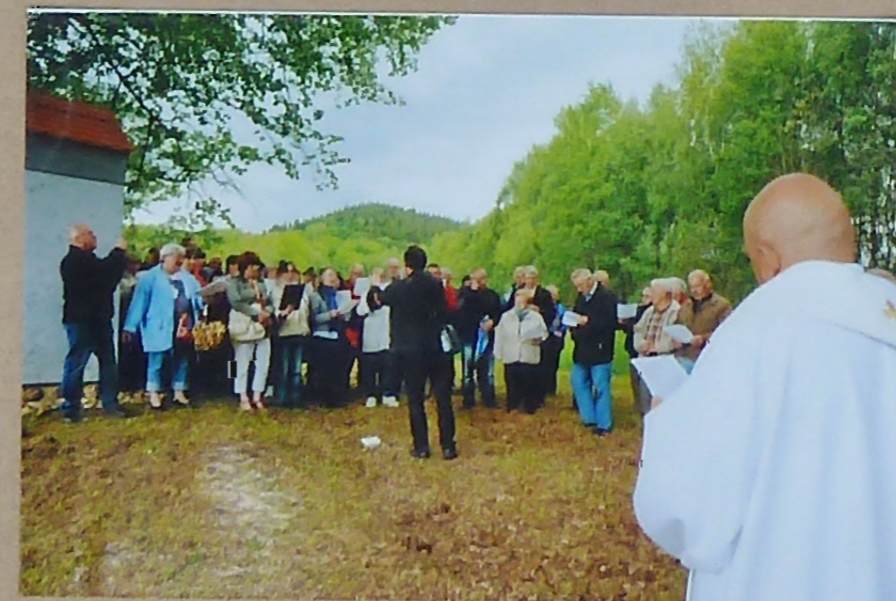
Z Centra Adalberta Stiftera v Horní Planá/Oberplan se dostavili účastníci německo-českého semináře lidové hudby („Furiant a sedlák“), kteří svým sborovým zpěvem citlivě provázeli slavnost

Aus dem Stifterzentrum in Horní Planá/Oberplan trafen die Teilnehmer eines deutsch-tschechischen Volksmusikseminars („Furiant und Sedlák“) ein, die mit ihrem Chor einfühlsam die Feier begleiteten